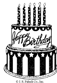
© J. S. Faluch Co., Inc.